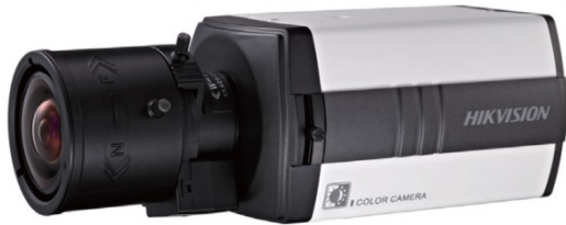
レンズオプション

650TVL High Definition Low Light Analog Box