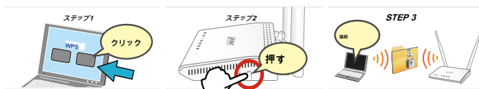
WPS ( Wi-Fi Protected Setup ) で クイック&イージーワイヤレス接続

IEEE 802.11nの技術を採用し、FRT-415Nは、より優れた無線信号を提供し、対応のルーターを802.11gのよりデータ転送速度とパフォーマンスが高いです。さらに、FRT-415Nは、不正アクセスや侵入を防ぐために、最新のセキュリティとファイアウォール機能を備えています。ただクリックします WPS ステップバイステップでそれを設定するにはボタンを押すと、簡単に無線ネットワーク上で取得し、自宅やオフィスでの高速インターネット通信を楽しむことができます。