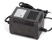
AC24V / 3A電源アダプタ