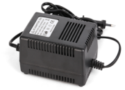
AC24V / 3A電源アダプタ