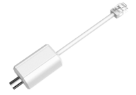
LR1002 ePoE以上の同軸コンバータ