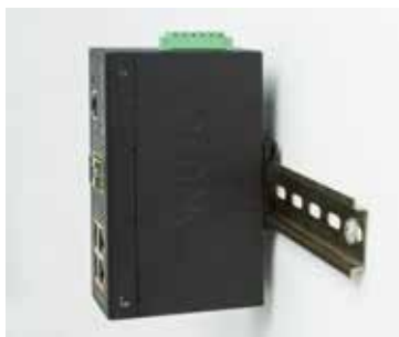
DINレールの取り付け

IGUP-805ATは、耐久性のあるコンポーネントと強力なハウジングケースを使用して特別に設計されており、プラントの床やカーブサイドの交通管制キャビネットなど、電氣的に過酷で気候的に厳しい環境で確実に動作します。IGUP-805ATは、コンパクトなIP30の頑丈なケースにパッケージ化されているため、DINレールまたは壁取り付けのいずれかでキャビネットスペースを効率的に使用できます。IP30の頑丈なケース保護とPoE設計により、IGUP-805ATは、サービスプロバイダー、キャンパス、および公共エリアで、PoEワイヤレスアクセスポイント、IPカメラ、またはIP電話をあらゆる場所に簡単かつ効率的に費用対効果の高い方法で展開するのに理想的です。また、-40~75°Cの広い温度範囲で動作するため、ほぼすべての場所に配置できます。