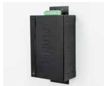
側壁取り付け (省スペース)